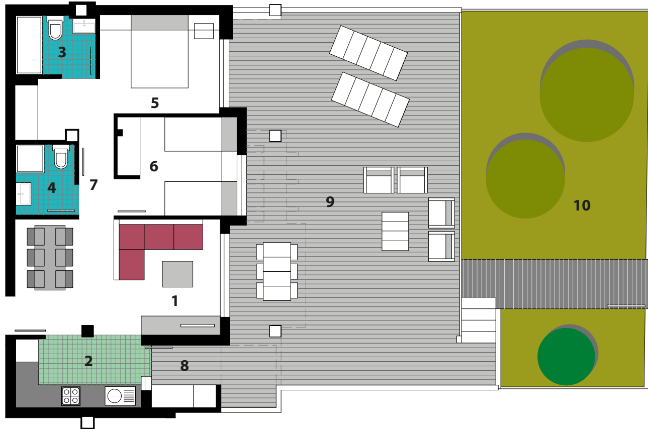
Planta Baja N°2