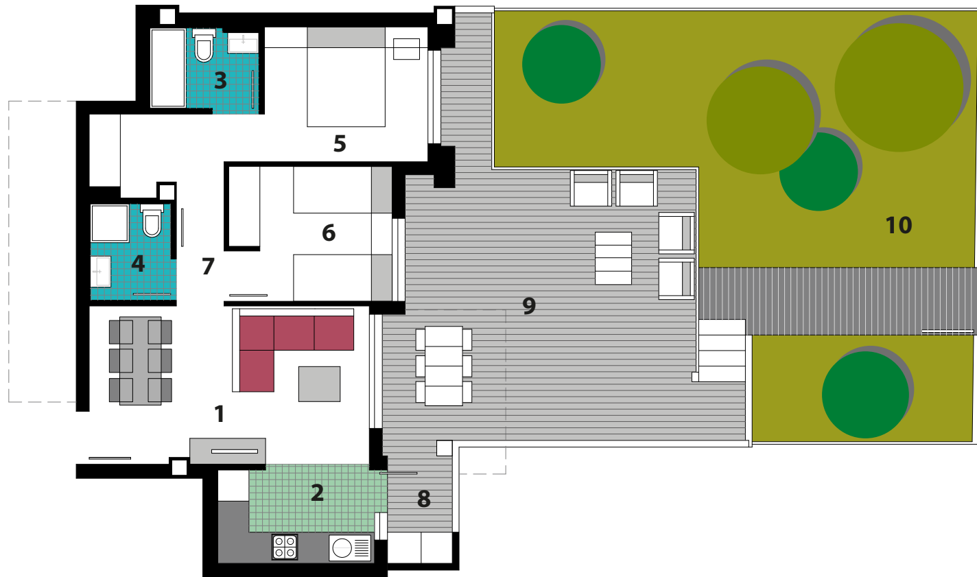
Planta Baja N°6